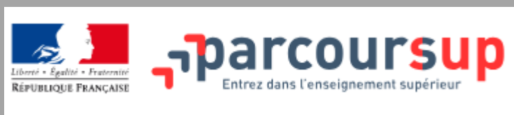
Parcoursup (pour étudiants)